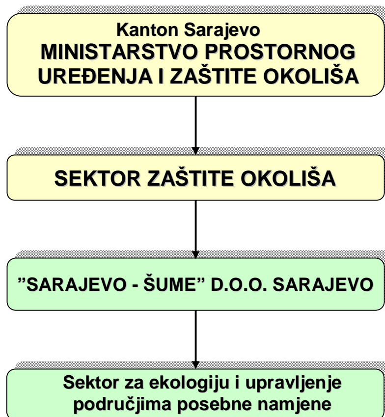
Grafikon 1. Institucionalni okvir za upravljanje

Finansiranje i svi drugi aspekti rada upravljačke institucije su regulirani posebnim aktima i sporazumima koje je Kantonalno ministarstvo za prostorno uređenje i zaštitu okoliša sklopilo sa upravljačem – Sarajevo-šume d.o.o. Sarajevo. Ovi sporazumi trebaju imati karakteristike dinamičnih dokumenata sa mogućnošću aneksnih dopuna shodno dinamici razvoja zaštićenog područja i potrebama Upravljača.