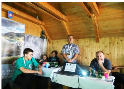
Sl. 1. Pozdravni govori na naučnoj manifestaciji o Prokoškom jezeru

U okviru dana planinarstva Federacije Bosne i Hercegovine – Festival planinarstva održana je naučna manifestacija dana 13. juna 2015. godine na Vranici, lokalitet Prokoško jezero. Na Manifestaciji učestvovali su prirodnjaci, koji su prezentovali aktuelne teme, a koje se tiču recentnog stanja prirodno-akvalnog kompleksa u neposrednom i posrednom slivu Prokoškog jezera sa naznakama negativnih tendencija prirodne evolucije i negativnih antropogenih zahvata koje ubrzavaju njegovo prirodnu evoluciju sa prijedlogom prognostičkih mjera i aktivnosti na eliminaciji negativnih tendencija budućeg razvoja.