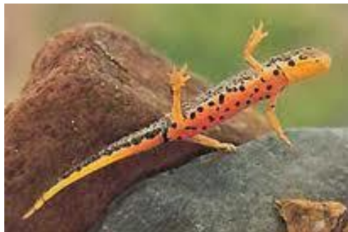
Sl. 4. Triturus alpestris reiseri Fig. 4. Triturus alpestris reiseri

1973). Biljne zajednice, posebno one iz vrste Carex , iz priobalnog područja se šire prema priobalnoj akvatoriji od kojih su nastali plutajući ili za obalu vezani busenovi, nekada ograničenih razmjera, a danas znatnih površina.