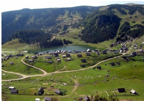
Sl. 2. Prokoško jezero – recentno stanje Fig. 2. Prokosko Lake – recent state

su tretirana jezerska naturalna stanja, potom stanja antropogenog presinga, zakonska legislativa i problemi renaturalizacije ovoga akvalnog kompleksa.